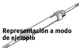
Representación a modo de ejemplo