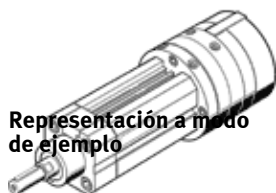
Representación a modo de ejemplo

La tolerancia de ángulo de giro en el vástago es máx. 2°. Al montar componentes adicionales en el kit pivotante no debe sobrepasarse el par de apriete máximo de 5,5 Nm.