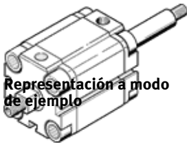
Representación a modo de ejemplo

Puede encontrar alternativas modernas introduciendo las cuatro primeras partes del código del producto en el campo de búsqueda.