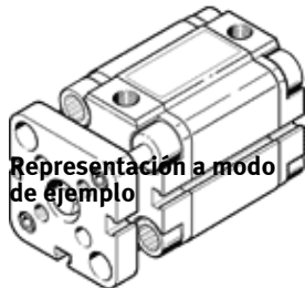
Representación a modo de ejemplo

Puede encontrar alternativas modernas introduciendo las cuatro primeras partes del código del producto en el campo de búsqueda.