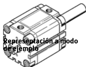
Representación a modo de ejemplo

Tipo sustituido. Disponible hasta 2025. Producto de alternativa: consultar portal de asistencia técnica.