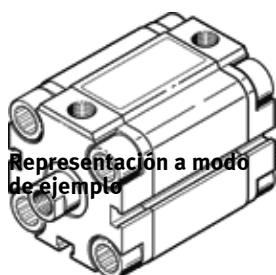
Representación a modo de ejemplo