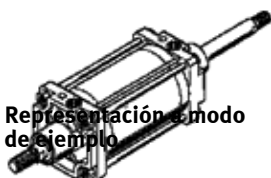
Representación 3D modo de ejemplo

Tipo sustituido. Disponible hasta 2016. Producto de alternativa: consultar portal de asistencia técnica.