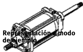
Representación 3D modo de ejemplo