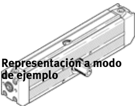
Representación a modo de ejemplo

Tipo sustituido. Disponible hasta 2017. Producto de alternativa: consultar portal de asistencia técnica.