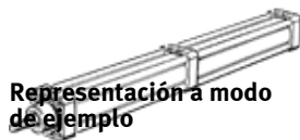
Representación a modo de ejemplo