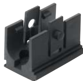
Acessório para fixação em placa de montagem (incluso no fornecimento)