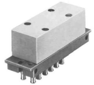
① Stecknippel für Kunststoffschlauch