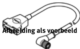
Abbeelding als voorbeeld