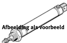
Afbeelding als voorbeeld