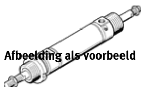
Afbeelding als voorbeeld