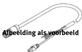
Afbeelding als voorbeeld