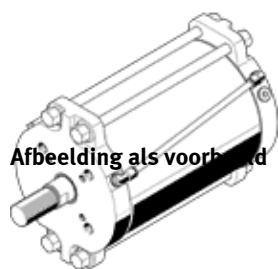
Afbeelding als voorbeeld

Einde productie. Leverbaar tot 2024. Zie het Support Portal voor alternatieve producten.