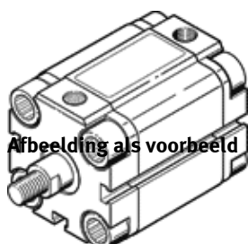
Abbeelding als voorbeeld