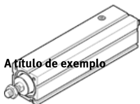
Artículo de exemplo