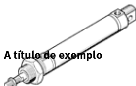
A título de exemplo