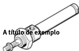
A título de exemplo

Este produto só pode ser obtido através da Festo USA.