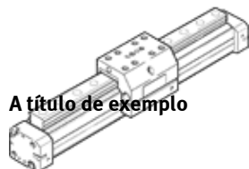
A título de exemplo

Este produto só pode ser obtido através da Festo USA.