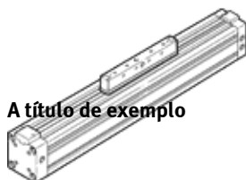
A título de exemplo

Type to be discontinued. Available until 2014. See Support Portal for alternative products.