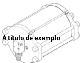
A título de exemplo

Produto será descontinuado. Disponível até 2024. Produto alternativo no Support Portal..