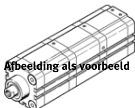
Afbeelding als voorbeeld