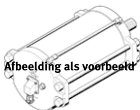
Afbeelding als voorbeeld

Einde productie. Leverbaar tot 2024. Zie het Support Portal voor alternatieve producten.