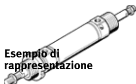
Esempio di rappresentazione

Tipo in esaurimento. Fornibile fino al 2022. Per alternative di prodotto, vedere il Support Portal.