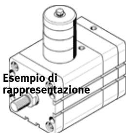
Esempio di rappresentazione

A norma ISO 21287, per rilevamento posizioni, con stelo con filetto femmina o maschio, con perno di bloccaggio integrato.