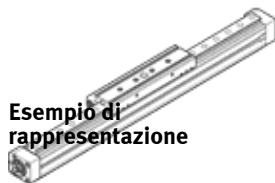
Esempio di rappresentazione

Tipo in esaurimento. Fornibile fino al 2019. Per alternative di prodotto, vedere il Support Portal.