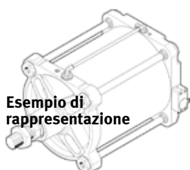
Esemplio di rappresentazione

Con regolatore elettropneumatico di posizione integrato, a doppio effetto, alesaggio 320 mm, interfacce di fissaggio secondo ISO 15552 sulla testata anteriore e posteriore, collegamento elettrico/pneumatico tramite connettore flangiato metallico e cavo NHSB (accessorio), a 4 conduttori, alimentazione di tensione 24 VDC, ingresso nominale 4...20 mA, segnale di feedback posizione 4...20 mA, posizione di sicurezza stelo uscente.