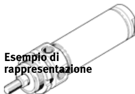
Esempio di rappresentazione

Questo prodotto è ottenibile soltanto tramite la consociata Festo in USA