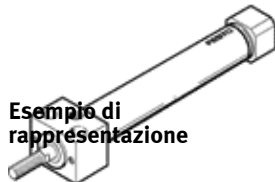
Esempio di rappresentazione

Questo prodotto è ottenibile soltanto tramite la consociata Festo in Corea