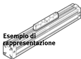
Esempio di rappresentazione

Questo prodotto è ottenibile soltanto tramite la consociata Festo in USA Tipo in esaurimento Disponibile fino a 2013.