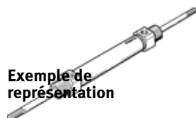
Exemple de représentation