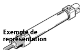
Exemple de représentation

Modèle en fin de vie. Disponible jusqu'en 2024. Voir le portail Support & Téléchargements pour des produits de remplacement.