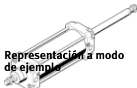
Representación a modo de ejemplo

según ISO 15552, NF E 49 003.1 y UNI 10 290, para detección sin contacto, con amortiguación de final de carrera ajustable por ambos lados. Este producto sólo se puede adquirir a Festo Gesellschaft Brasil.