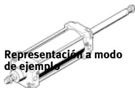
Representación a modo de ejemplo

según ISO 15552, NF E 49 003.1 y UNI 10 290, para detección sin contacto, con amortiguación de final de carrera ajustable por ambos lados.