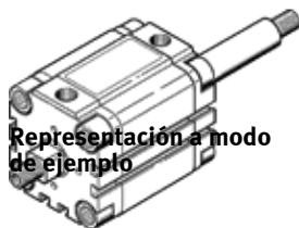
Representación a modo de ejemplo

Tipo sustituido. Disponible hasta 2025. Producto de alternativa: consultar portal de asistencia técnica.