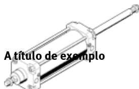
A título de exemplo

Este produto só está disponível por meio da Festo Brasil.