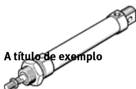
A título de exemplo