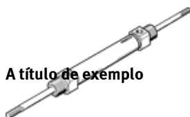
A título de exemplo