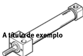
A título de exemplo