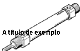
A título de exemplo

Produto será descontinuado. Disponível até 2024. Produto alternativo no Support Portal..