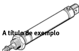
A título de exemplo