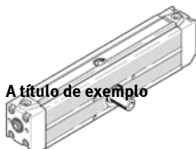
A título de exemplo

Produto será descontinuado. Disponível até 2017. Produto alternativo no Support Portal.