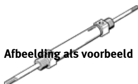
Afbeelding als voorbeeld