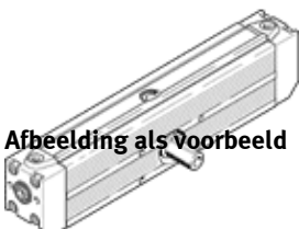
Afbeelding als voorbeeld

Einde productie. Leverbaar tot 2017. Zie het Support Portal voor alternatieve producten.