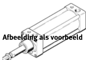
Afbeelding als voorbeeld