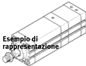
Esempio di rappresentazione

A norma ISO 21287, per rilevamento posizioni, con stelo con filetto femmina o maschio.