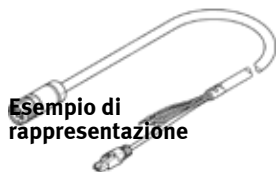
Esempio di rappresentazione